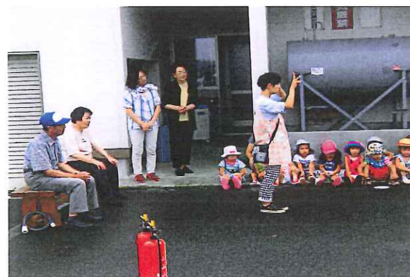
消防署員、地域の方との避難訓練

8月23日に避難訓練が行われました。訓練が始まって約5分で避難することができ、日頃の練習の成果が出ていると評価されました。地域の方々も来て下さり、避難訓練の様子を見ていただきました。年長さんは放水体験をしました。