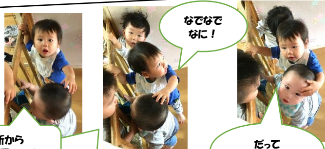
柵の所から「ばあ…可愛い！」と兄さんたち