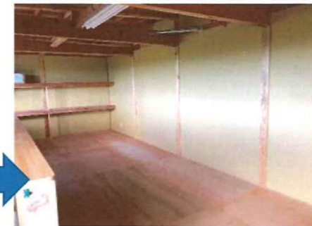
〈階段を上っていくと〉

水害に遭ってしまった際、【高い所に避難する】ために子ども達と小屋の階段の上り下りを練習しました。手すりを使いながら上っていく事、避難する際は怪我のないようお友達を推さない事など一つ一つ確認しながら進めていきました。