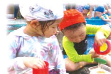
ねえ!色が変わったよ!?